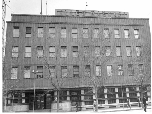
Şekil 2. İller Bankası, Seyfi Arkan

mış bir modernlikle karşı karşıya getiren bir mimarlıktır.