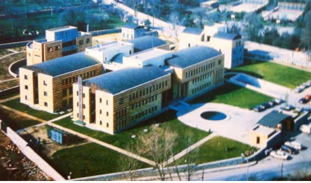
Şekil 9. Doğan Şirketler Grubu Holding Binası

Silivri'deki Klassis Resort Hotel, çalışmalarını Belçika'da sürdüren mimar Şefik Birkiye tarafından tasarlanmıştır. Söz konusu yapı grubu, geniş bir alana yayılan, farklı yüksekliklerdeki kademeler oluşturan parçalı ve hareketli kütlelerden oluşmaktadır. Bu hareketlilik, tamamen rasyonel formların farklı açılarda düzenlenmesiyle oluşturulmuştur. Tasarımda, Hint, Antik