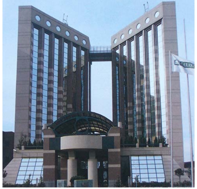
Şekil 4. Garanti Bankası Genel Müdürlük Binası

Şişli Büyükdere Caddesi üzerinde bulunan Kalsın İş Merkezi, Türkiye'de yaşayan Japon mimar Tatsuya Yamamoto ile Gökhan Altuğ tarafından tasarlanmıştır. Bir köşe parselde yer alan yapı, sekiz katlıdır. Bina kütlesi, cam yüzeylerle kaplanmış bir küp görünümündedir. Ancak, binanın çatı bölümündeki saçaklar, Uzak Doğu mimarisini çağrıştırmaktadır. Çatıya yerleştirilen fenerler ise, tarihten gelen yapı elemanı olan kubbelerden oluşmaktadır. Bu elemanlar, orijinal hallerinden farklı bir şekilde, tasarıma mimarların yorumu katılarak biçimlendirilmiştir (Şekil 5).