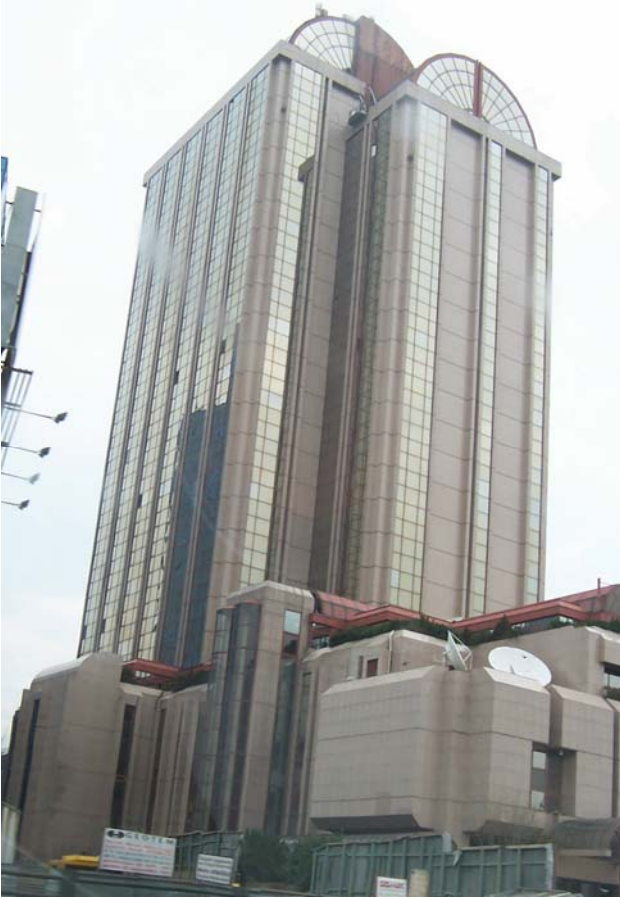
Şekil 3. Princess Hotel

edilemediği görülmektedir. Bunların yanında, Antik dönem, eski Mısır ve Bizans'a ait tarihsel yapı elemanları tasarımda yerini almıştır. Burada, belli bir tarihsel dönemin değil, farklı dönemlerin mimari özelliklerinin bir arada kullanılması söz konusudur. Bu elemanlar, geçmişteki biçimleriyle değil, geometrik soyutlamalar yoluyla aktarılmıştır (Şekil 4).