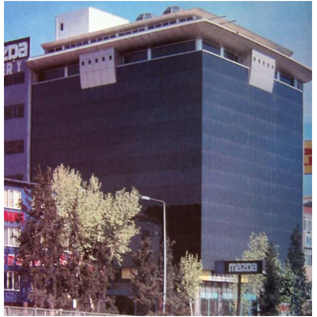
Şekil 5. Kalsın İş Merkezi

Serdar İnan'ın tasarımı olan V Plaza, Mecidiyeköy'de yer alan, sekiz katlı bir büro binasıdır. Kütlesi bir küpe yakın oranları olan prizma yapının cephe düzenlemesinde de dikdörtgen ve daire gibi asal geometrik formlar vurgulanmıştır. Genelde Rasyonalizm'in disiplini içinde olan bu yapıda Pop-Mimarlık olarak değerlendirilebilecek dekoratif öğelerle karşılanmaktadır (Şekil 6).