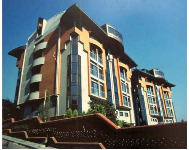
Şekil 1. Mercan Sitesi

EGS İş Merkezi, Yalçın ve Burak Sağlıkova tarafından tasarlanmıştır. Yeşilköy’de bulunan yapı kompleksi, altı ofis bloğu ve alışveriş merkezinden oluşmaktadır. Bloklar, haç formlu prizmalar ile iç içe geçmiş ters piramitlerden oluşmaktadır. Tasarımda, eski Roma, Mısır ve Bizans’ta yer alan mimari elemanlar yorumlanarak, mimari temsil ve alay ile birlikte kullanılmıştır. Ayrıca, çeşitli renklerden oluşan malzemeler farklı geometrik formlarla birlikte kullanılmış, hareketli ve renkli cepheler elde edilmiştir (Şekil 2).