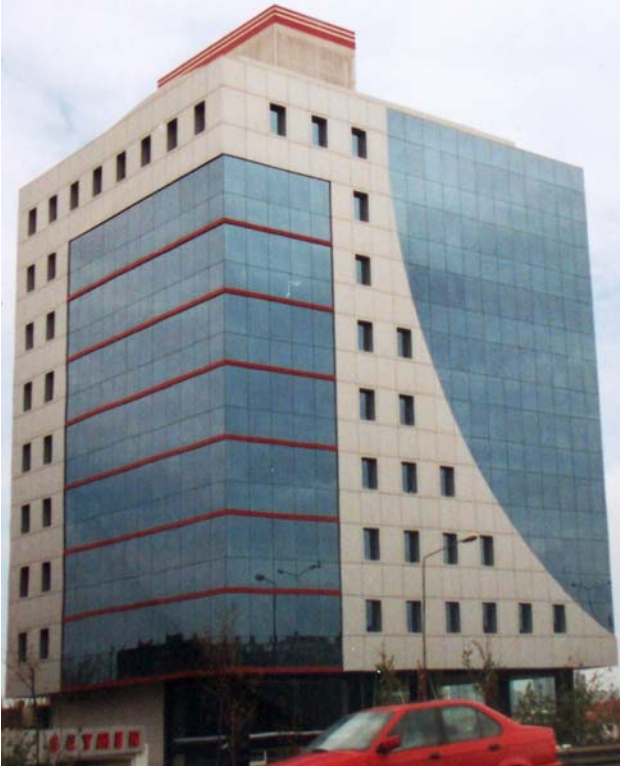
Şekil 6. V Plaza

Maslak'ta yer alan Plaza Spring Giz'in tasarımı, Giz İnşaat'a aittir. Söz konusu yapıda, iki kanattan oluşan yirmi ofis katı ile ortalarında yükselen çekirdek bölümü yer almaktadır. Kanatlar tamamen cam yüzeyli prizmalardan oluşan katı rasyonel bir tutum sergilerken, orta bölümde düşey ızgara ve üst noktada dairesel bir boşluk bırakılmıştır. Burada, New York'taki AT&T binasındaki tutuma benzeyen, büyükbaba saattinden esinlenen bir tarihçilik söz konusudur (Şekil 7).