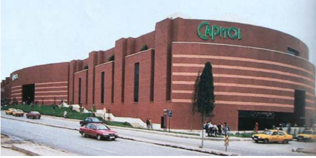
Şekil 12. Capitol Alışveriş Merkezi

yüzeylerin dairesel hatlarla birbirine bağlandığı bir kütleye sahiptir. Cepheler, dik açılı prizmaların ritmik hareketleriyle oluşturulmuştur. Cephenin simetrik olduğu yapıda, ortadaki ana giriş içe doğru çekilerek sahne etkisi yaratılmak istenmiştir. Bu da tasarıma temsil ve oyun gibi kriterlerin girmesine neden olmakta ve yapıya Post-Modern bir kimlik kazandırmaktadır (Şekil 12).