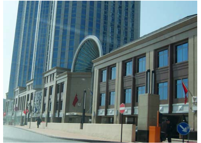
Şekil 11. İş Bankası Genel Müdürlük Binası

İş Bankası Genel Müdürlük Binası'nın ön projesi Doğan Tekeli ve Sami Sisa, uygulama projesi ise, A.B.D.'li Swanke Hayden Connell'e aittir. 4. Levent'te bulunan yapı, üç katlı bir yatay blok üzerinde yükselen bir adet kırkbeş katlı, iki adet yirmidokuz katlı ofis bloğundan oluşmaktadır. Söz konusu yapının yatay blok cepheleğinde Post-Modern bir anlayışa sahip olduğu görülmektedir. Burada, kemerli taç kapılar, tonoz, kubbe, korniş ve söve gibi tarihsel elemanlar kullanılmıştır. Bunların yanında, metal malzemenin dekoratif amaçla kullanılması, Art Deco mimari tarzına gönderme yapan Neo-Art Deco bir yaklaşımı sergilemektedir (Şekil 11).