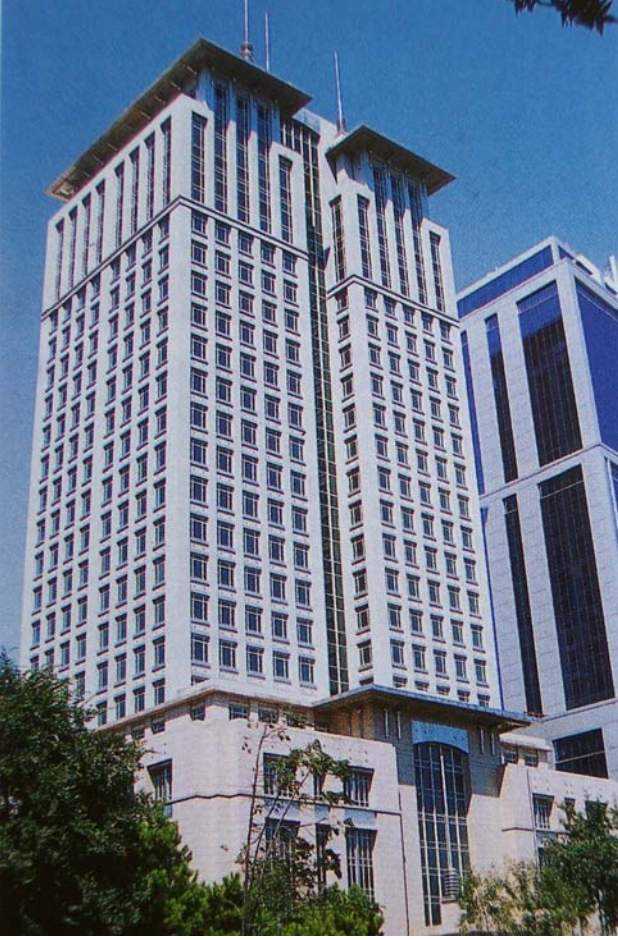
Şekil 8. Bank Ekspres Binası