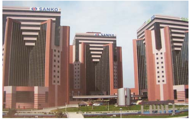
Şekil 2. EGS İş Merkezi

Maslak’taki Princess Hotel, Ertem Ertunga tarafından tasarlanmış, yirmiyedi kattan oluşan bir yapıdır. Tamamen rasyonel formlardan oluşan bu yapının çatısında tarihten gelen bir eleman olan tonozun kullanılması, ona farklı bir anlam yüklemektedir. Ayrıca, yapının kaide bölümünün birbirinden farklı birçok geometrik formun hareketli kompozisyonundan oluşması, tanımlamayı güçleştiren bir çeşitlilik yaratmaktadır (Şekil 3).