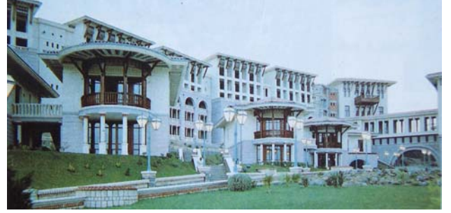
Şekil 10. Klassis Resort Hotel

Roma, Rönesans, Barok ve Birinci Ulusal Türk Mimarlığı dönemine ait mimari elemanlar, malzeme çeşitliliği içinde, bir arada kullanılmıştır (Şekil 10).